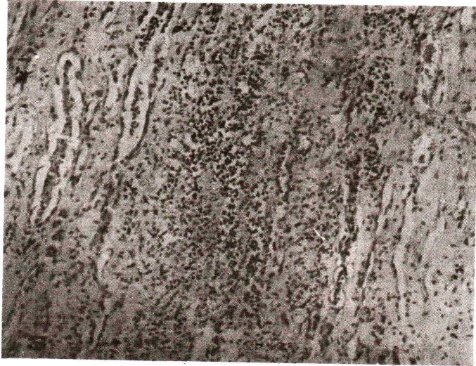
ภาพที่ 3 ไ้ต แสดงการอักเสบเฉียบพลัน (Acute pyelonephritis) H&E \times 100