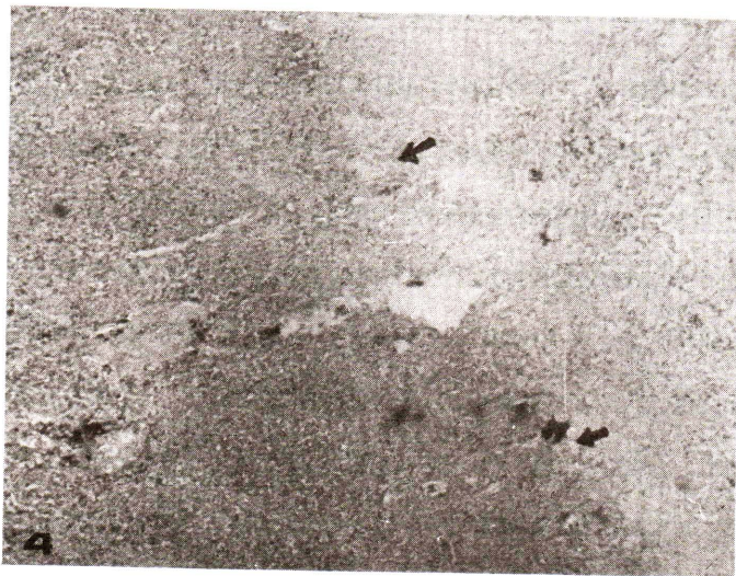
ภาพที่ 4 ปอด แสดง Fibrocystic granuloma H&E \times 100