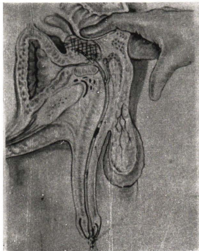
Fig. 489.—Fluid being expressed from the vesiculae and the prostate gland