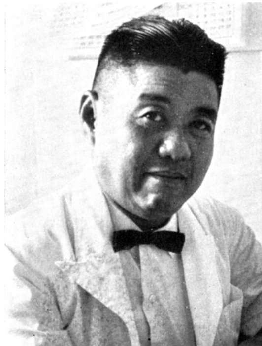
รูปที่ 1. ศาสตราจารย์กิตติคุณ นายแพทย์ สุนิตย์ เจริญศิริวัฒน์

เมื่อ 60 ปีก่อนนิสิตแพทย์และคนไข้ต่างคุ้นเคยกับการเห็นคุณหมอคนช่างท่อม ผูกหูกระต่าย (รูปที่ 1) อารมณ์ดี สอนหนังสือหรือตรวจคนไข้ อยู่ที่ห้องตรวจเล็ก ๆ ที่ชั้นล่าง ตึกจักรพงษ์ คุณหมอต่านนั้นคือ ศาสตราจารย์กิตติคุณนายแพทย์ สุนิตย์ เจริญศิริวัฒน์ ปรมาจารย์ทางโรคผิวหนังของประเทศไทย และคณะแพทยศาสตร์ จุฬาลงกรณ์มหาวิทยาลัย ท่านอาจารย์จบมัธยม 8 จากโรงเรียนอัสสัมชัญ และสำเร็จการศึกษาจากคณะแพทยศาสตร์และศิริราชพยาบาล (ศิริราชรุ่น 53) ท่านอาจารย์ได้ไปศึกษาต่อสาขาโรคเขตร้อนที่เมือง