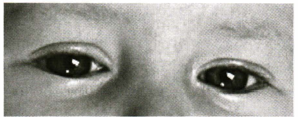
Infantile Botulism Hypotonia; Enlarged pupils

3. โบทูลิซึมจากบาดแผล (Wound botulism) พบได้น้อย เกิดจากการปนเปื้อนสปอร์ของเชื้อที่บาดแผลตามผิวหนัง เชื้อจะเจริญเพิ่มจำนวนได้หากแผลอยู่ในสภาวะที่มีออกซิเจนต่ำ (6) ในต่างประเทศพบในกลุ่มผู้ฉีดยาเสพติดด้วย อาการจะคล้ายกับอาการทางระบบประสาทจากการติดเชื้อจากอาหาร แต่ระยะเวลาหลังติดเชื้อจนกระทั่งเกิดอาการอาจนานตั้งแต่ 4 วัน ถึง 2 สัปดาห์